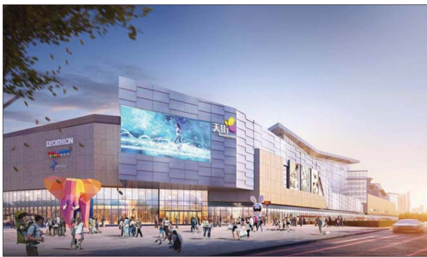
烟台龙湖天街效果图。

作为龙湖商业的拳头产品,相对于目前烟台现有的商业综合体,烟台龙湖天街有何特点和独到之处?又将会在哪些方面给烟台市民新的消费体验?郭新胜介绍,烟台龙湖天街将成为烟台首个体验式时尚商业地标,满足周边居民、旅游客群的日常休闲购物、餐饮娱乐需求。 同时,龙湖云集海量国际一线品牌