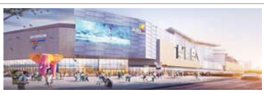
一座天街繁华一座城②