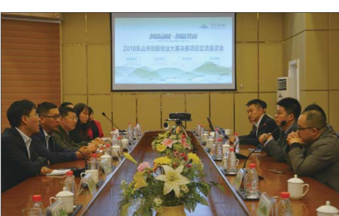
座谈会上,项目方与企业方进行交流,本次大赛共有10个项目与乳山优秀企业签订合作协议,8个项目达成合作意向。

“乳山还举办了双招双引洽谈对接活动,与会的专家学者们逐一向乳山企业展示研究成果,对于契合乳山相关产业方面的研究成果进行详细解析。”市人社局相关负责人表示,重点招商部门向专家们介绍了乳山人才发展环境、人才需求、人才优惠政策等,并向专家们发出了诚挚的邀请,企业也争相推介发展环境情况、人才需求和项目需求,并与专家们现场进行互动交流。目前,已有部分海内外专家学者来乳实地考察,了解企业情况,洽谈合作事宜。下一步,乳山将重点跟踪,为其投资建厂提供最优惠的产业政策和人才扶持政策,协调相关部门为其入驻提供便捷服务保障。