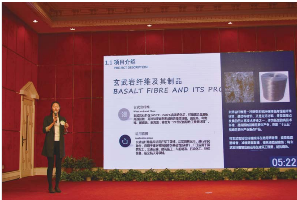
创新创业大赛上,选手介绍自己的创业项目。

们现场进行互动交流。目前,已有部分海内外专家学者来乳实地考察,了解企业情况,洽谈合作事宜。下一步,乳山将重点跟踪,为其投资建厂提供最优惠的产业政策和人才扶持政策,协调相关部门为其入驻提供便捷服务保障。