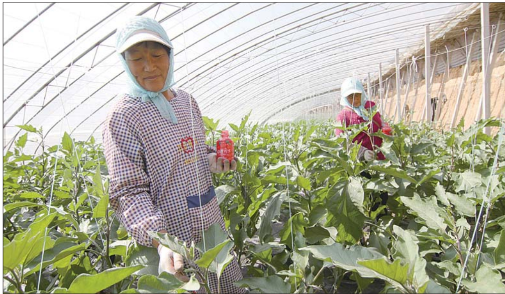
沂水县沙沟镇卞庄扶贫投资大棚内,茄子已经开花挂果,村民正在给茄子授粉。

扶贫不是简单地给钱给物。自2015年至今,29.28亿元的产业扶贫资金投入如果平均到户,临沂全市的25.5万贫困户每户能分到1.1万余元。这样一算似乎大家都都能脱贫,但这笔钱花完之后以及新出现贫困人口咋办?如何让这29亿钱生钱,像不竭源泉一样用之不