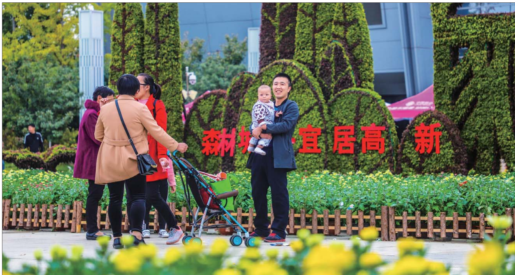
森林城市,宜居高新。