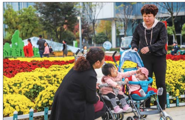
和朋友一起来赏菊。