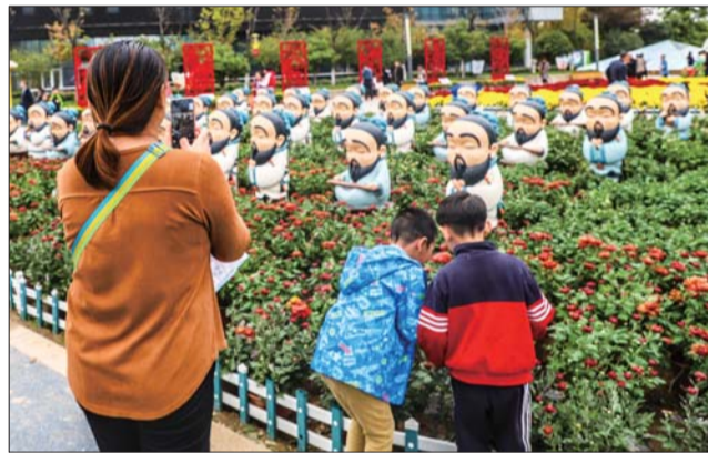
竞相绽放的菊花,引得游客纷纷拍照留念。

文相融合,不仅融入了六艺、十二生肖、梁祝等传统文化,更结合创城、宜居高新等元素予以设计。囊括传统菊展、菊展小品、植物雕塑立体造型等多种表现形式。其中,植物造型、创城小品共计19组,周围配以各色菊花,烘托欢乐气氛。同时设置品种菊展一处,展示独本菊50余种。