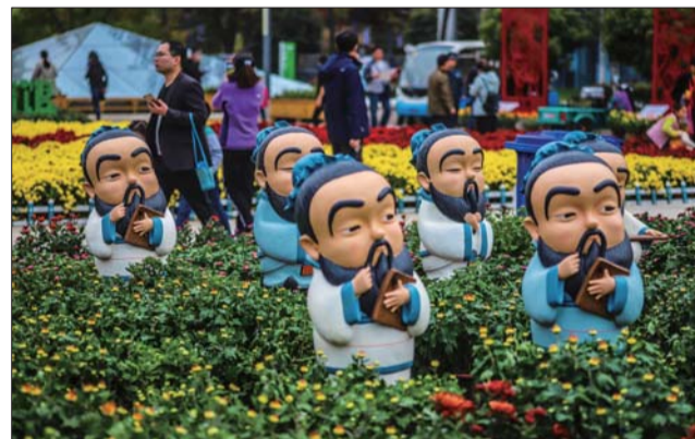
菊花展融合了六艺元素。