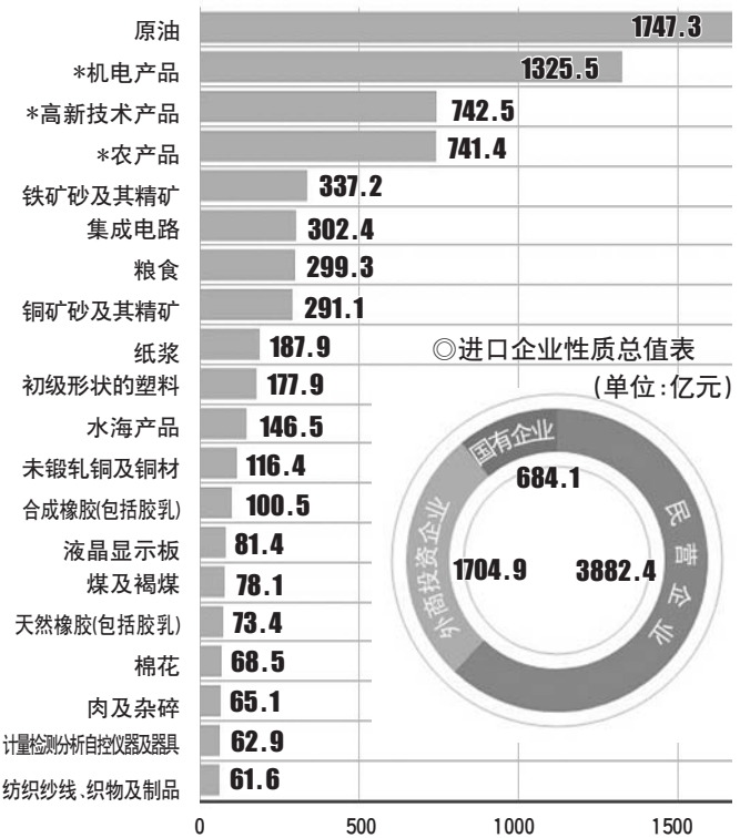
◎进口企业性质总值表(单位:亿元)