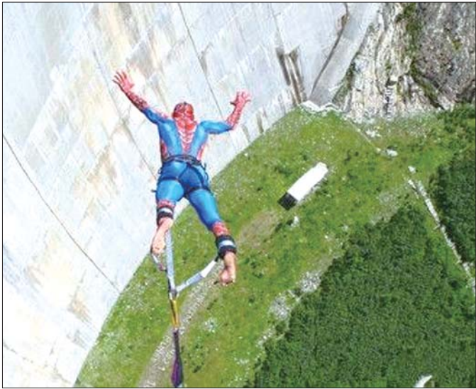
奥地利卡林西亚州科恩布莱茵大坝