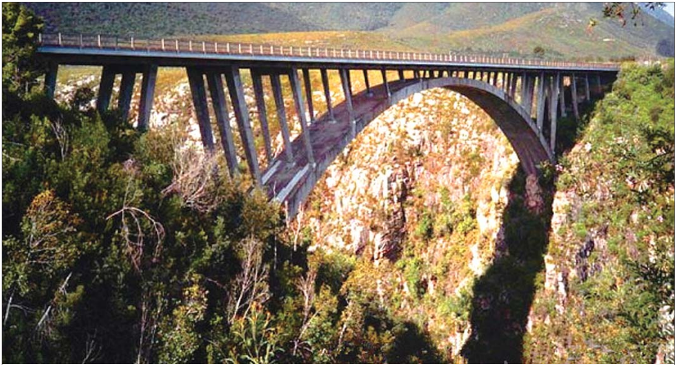
►南非西开普省布劳克朗桥

站在几十米甚至几百米的高空,身上除了几根绳索的安全装备,脚上系上橡皮筋,然后做自由落体运动…… 啊!啊!啊!啊! 或者你连“啊”都喊不出来,因为以前坐过垂直过山车,在高速高空的坠落,人不仅会失重也会短暂失声。但是经过大脑一片空白后的急速下降之后,你绝对会再想来一次!因为这感觉实在太爽啦! 据说蹦极是最接近死亡的热血体验!不知道是不是每个人都有一个蹦极梦,把心交给天空,挑战快速坠落的刺激和快感!最后享受劫后余生、重返地球表面的欣喜和那挑战自我的英雄心态!今天小编就给敢于挑战的真正的勇士安利10个蹦极地。