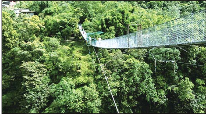
尼泊尔胡特可西河最后的圣地

你可能会听你的另一半说他愿意为你做任何事情,即使上月球或穿越最深的海洋。如果你想和你的另一半在最高的起重机上一起蹦极,那么Altopiano di Asiago将会是你们的理想去处。十分适合新婚夫妇或热恋中的情侣一起挑战。