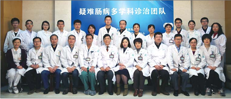
山东大学齐鲁医院疑难肠病多学科诊治团队

伴随着经济发展，我国炎症性肠病的发病率呈上升趋势。然而由于该病的症状和多种疾病极为相似，误诊和漏诊的情况时有发生，甚至有不少患者数年来奔波多家医院仍不能得到规范诊治。为了进一步规范强化炎症性肠病的治疗，山东大学齐鲁医院专门开设了炎症性肠病门诊，并组建了一支疑难肠病多学科诊治团队。