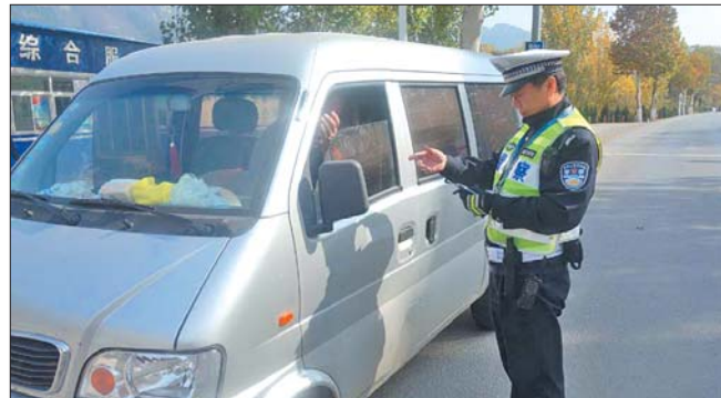
近日,长清交警大队张夏中队以加强路面秩序防控为抓手,开展专项行动,共查处涉牌涉证3例、货车超载2例、酒驾1例、面包车超员4例,其他违法10例。

经过进一步分析研判,警方确认鲁JA66××/鲁JK7××挂红色重型半挂牵引车为肇事车辆。民警随即与车辆所属企业及驾驶员取得联系,告知其事故经过。近日,涉事运输企业负责人、肇事司机阴某泉(男,51岁,山东肥城人)驾驶肇事货车到城区中队接受处理。目前,事故正在进一步处理中。