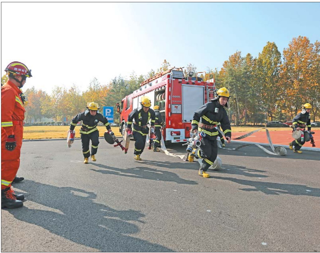
玉符街中队灭火实战演练现场。

长清区院积极开展“综治宣传月”、“举报宣传周”、“宪法宣传日”等活动,送法下乡进社区,开展法律咨询。组织开展打击防范涉众型经济犯罪、扫黑除恶等宣传活动。开展“检察开放日”活动,定期邀请人大代表、政协委员、各民主党派、工商联及市民代表,到区院参观办案工作区、预防警示教育展厅、控申接待大厅等场所,向他们详细介绍检察机关的性质、职能及机构设置情况,为群众亲身感受检察、支持检察提供有效的监督途径和重要平台。(王运伟)