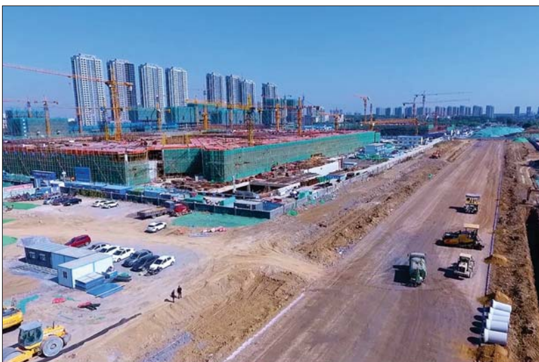
香江路航拍实景图。