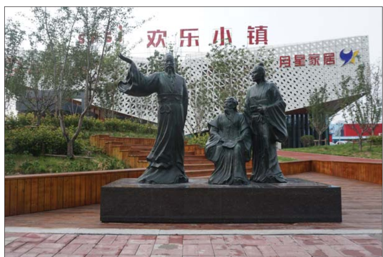
千岛樱花花海古今名人雕塑实景图。