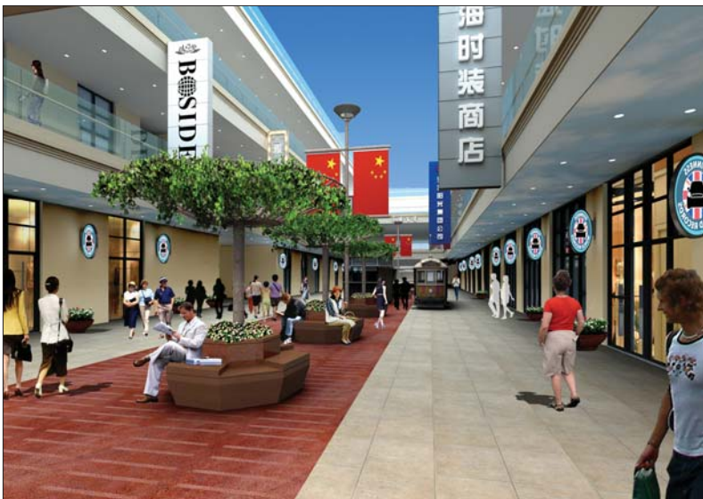
上海南京路步行街主题街区效果图。