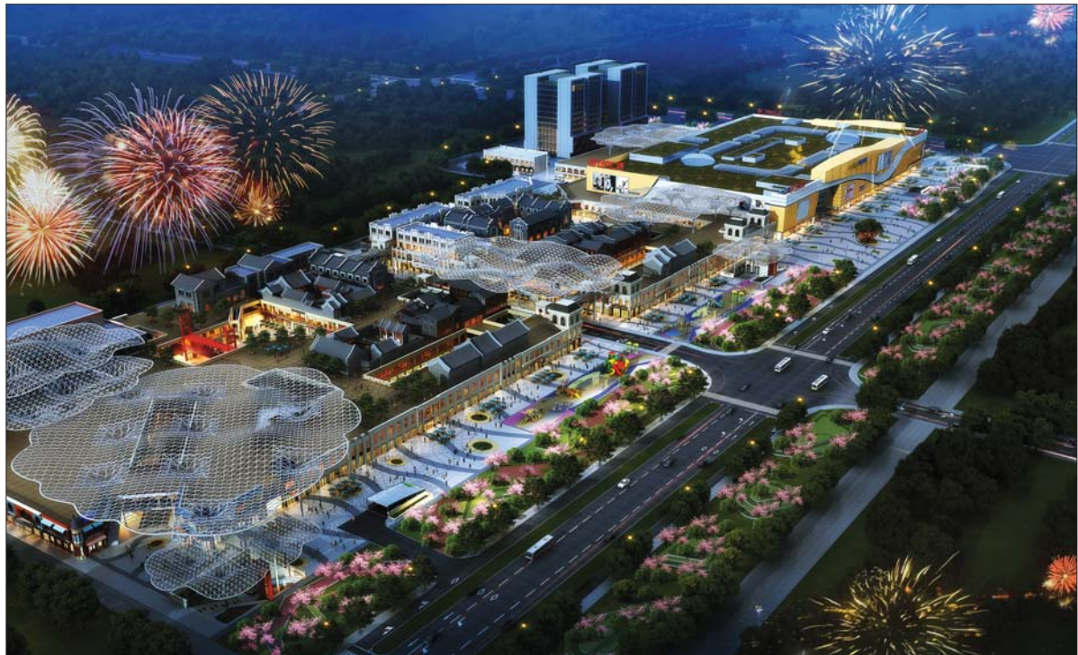
万达广场·欢乐小镇夜景鸟瞰图。

据了解，昌润路(白庄站—香江路)电力线路规划，规划电力电缆24孔，规划总长约650米，该供电线路出自110KV白庄变电站，沿昌润路东侧规划位置向北铺设至香江路以南规划位置；香江路(昌润路—二干