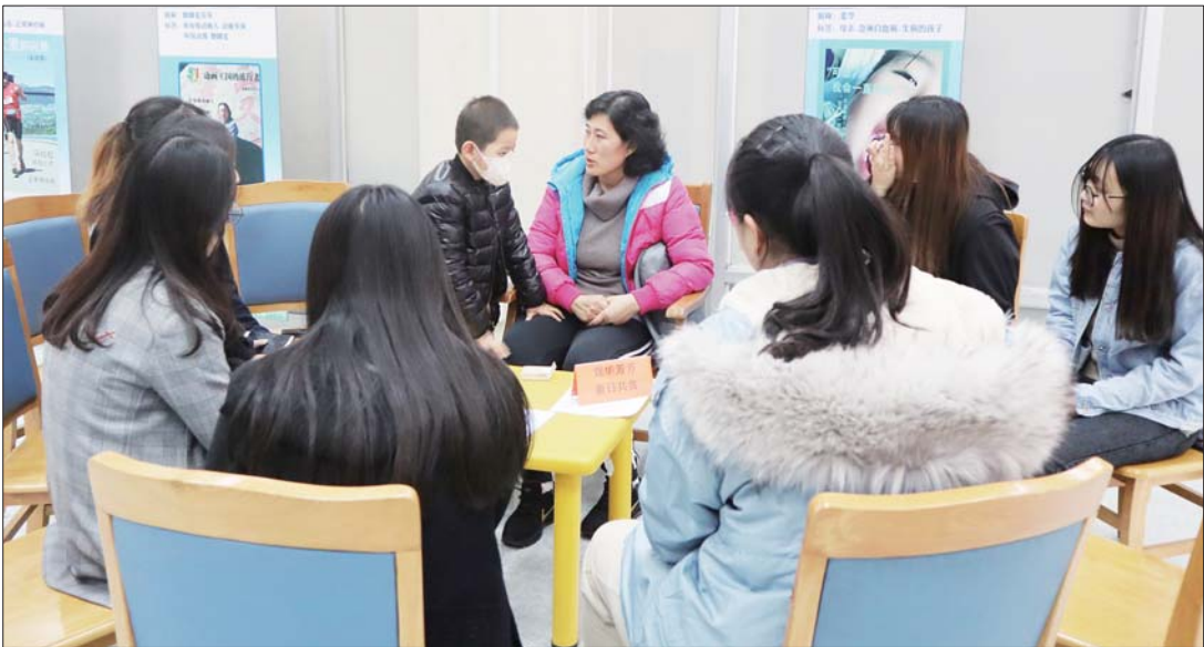
18日,小昱衡跟着母亲在山东省图书馆参加活动。

6月份的时候,小昱衡开始发烧。不久后,她母亲发现孩子的上腭开始发黑,脸部浮肿,黑斑逐渐扩至鼻子,越来越严重。