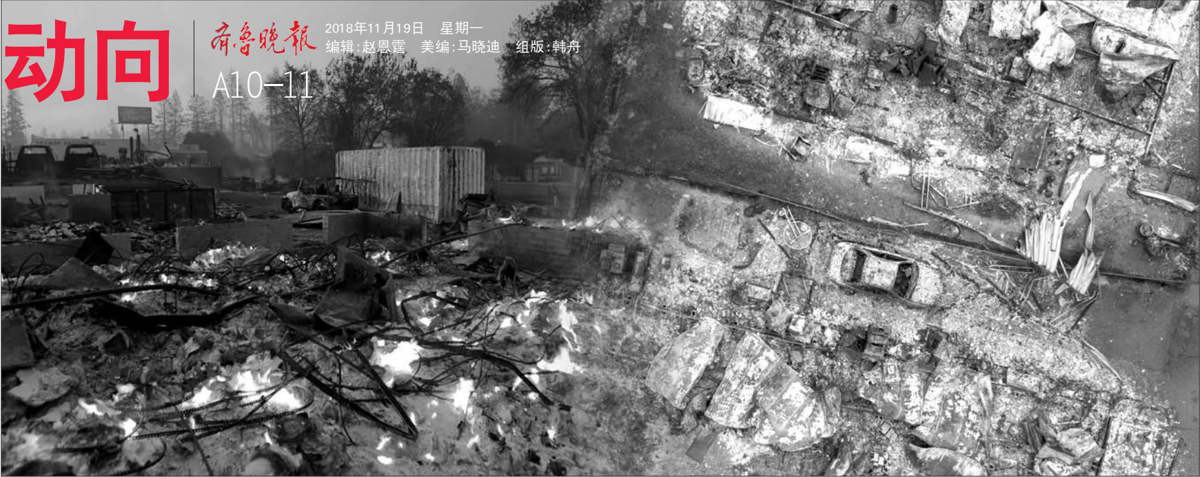
山火“坎普”将加州北部小镇天堂镇烧成一片废墟。(拼版照片) 新华/法新