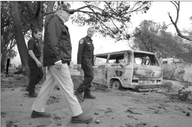
17日,美国总统特朗普视察加州山火灾区。