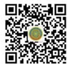
北京交通大学(威海)科普教育基地二维码