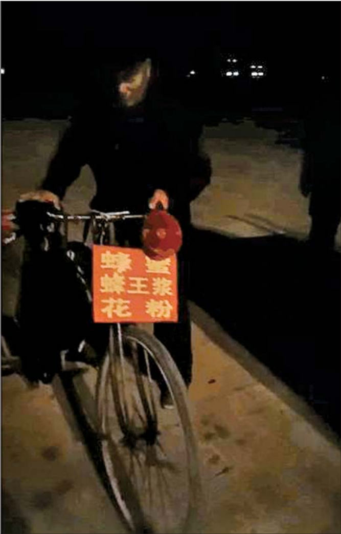
卖蜜老人不知怎么就误入高速公路。