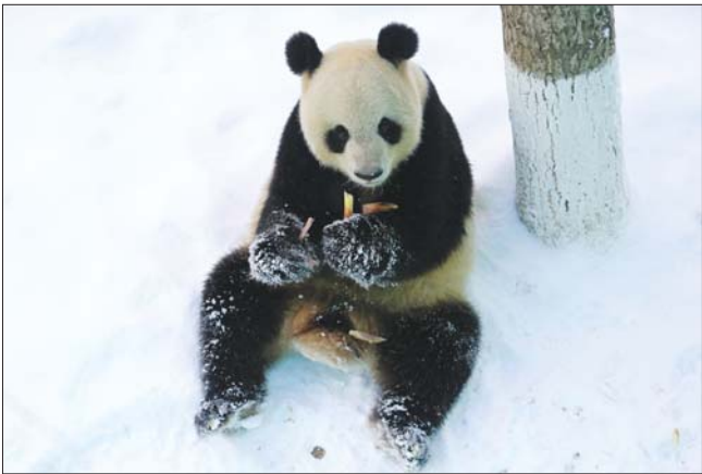
西霞口动物园,大熊猫戏雪。

代化温泉度假村,延续唐时距今约1400多年的老汤原址而建,属纯天然温泉;香海温泉是目前距离大天鹅栖息地最近的温泉度假区,可以边泡温泉边赏天鹅,其水取自地下近千米,具有极高的养生保健功效。