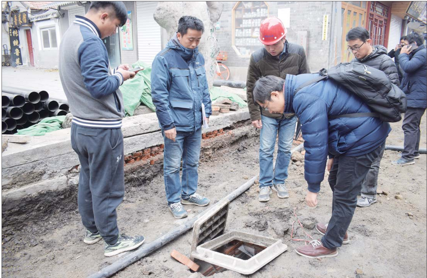
明府城管理中心工作人员和设计人员查看刚发现的新泉。

来的,后来我们专门在泉眼的西边挖了一米深,结果也没有水流过来,看来这是独立的泉眼。”施工人员介绍,因为泉眼刚刚挖出来,现在尚不能确定