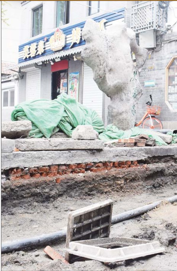
新泉位于芙蓉泉东侧五六米处。

记者了解到,芙蓉街虽然很有名,但是除了芙蓉泉比较有名外,其他泉池都比较平淡,关帝庙中的泉水更像是井,水流