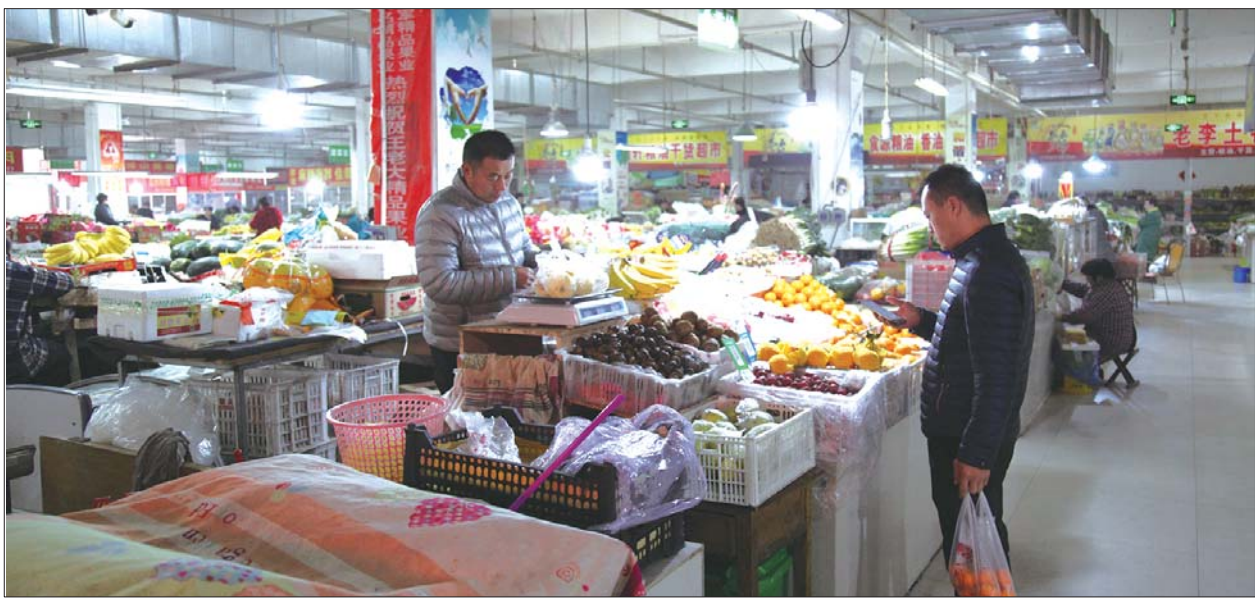
整洁的市场环境让市民放心购物。