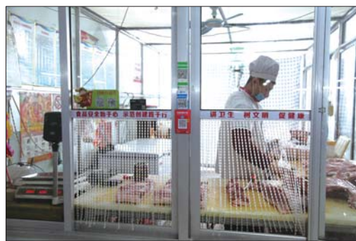
完善的防蚊蝇设施。