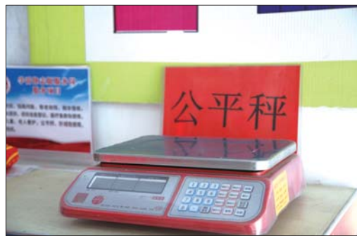
摆在市场门口的公平秤。