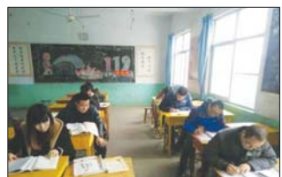
沂源县三岔中心学校开展半天无课日教研活动,提升教学水平。(董振湖)