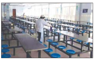
沂源县三岔中心学校强化餐厅卫生管理,做到无污物、无异味。(董振湖)