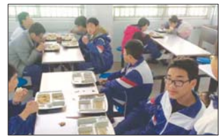
沂源县三岔中心学校积极开展光盘行动,培养节约品质。(董振湖)