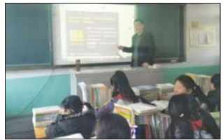
沂源县三岔中心学校进行雾天安全教育,确保学生安全。(董振湖)