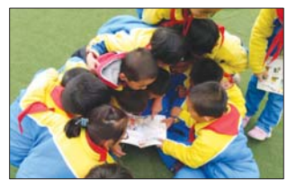
沂源县三岔中心学校小学部开展讲故事活动。(董振湖)