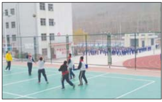
沂源县三岔中心学校积极开展各类德育大课间活动。(董振湖)