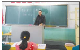
沂源县三岔中心学校召开冬季安全主题班会。(董振湖)