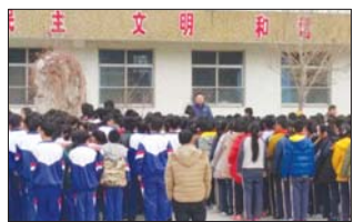
沂源县三岔中心学校利用各种机会对学生进行综合安全教育。