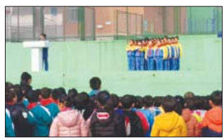
沂源县三岔中心学校开展儿歌表演背诵,用传统文化充实学生心灵。(董振湖)