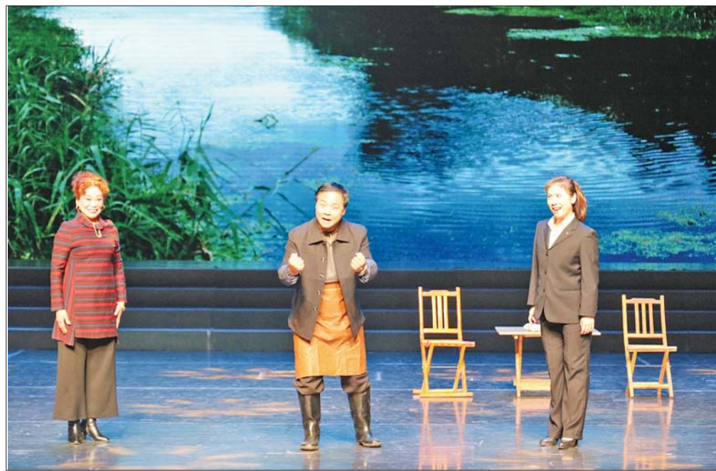
吕剧小品《撵猪》获得一等奖。

本报12月5日讯(通讯员刘佳慧) 11月28日,2018年度济南市新创作优秀群众文艺作品评选在市文化馆举行,由商河县选送的三个原创节目分获一、二、三等奖,商河原创群众文艺节目已经在济南市实现“四连冠”。