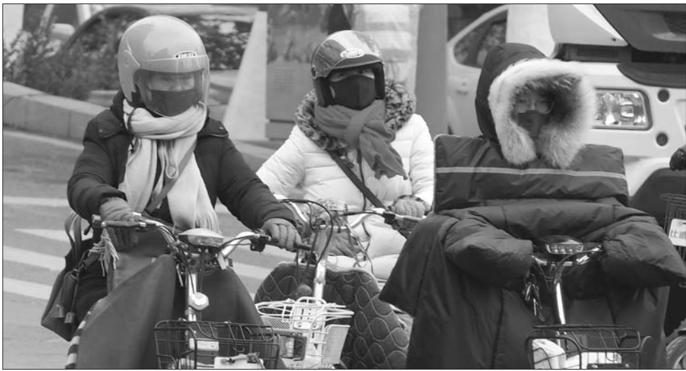
6日,济南寒风刺骨,气温陡降。出行的市民纷纷穿上了应对三九天的衣服。

6日中午,山东省气象台继续发布寒潮蓝色预警信号:受强冷空气持续影响,预计6日夜至9日,我省将出现大风和降温天气。气温将明显下降,内陆地区的降温幅度将在8℃左右,沿海地区6℃左右。7日至9日早晨最低气温:鲁西北和鲁中山区-8℃~-10℃,其他地区-5℃~-7℃。而全省的最高气温,预计也将在0℃上下。预计到下周一,山东内陆地区的最高气温才能重回0℃以上。