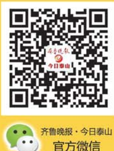
齐鲁晚报·今日泰山 官方微信