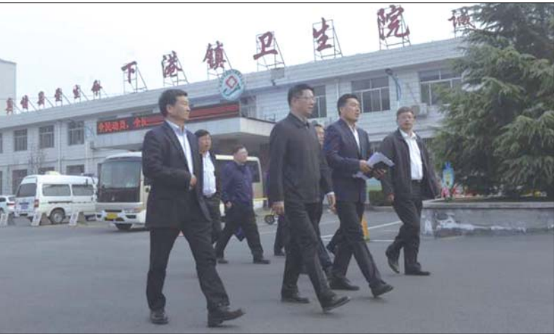
文/图 本报记者 张译文

近年来,泰安市医疗卫生服务能力和质量稳步提升,群众健康保障水平显著提高。今年,全市卫生健康系统不忘初心,知难而进、奋发进取,担当作为,切实增强做好新时代卫生健康工作的紧迫感和使命感,牢固树立“没有全民健康,就没有全面小康”的发展理念,准确把握“走在前列、全面开创”的总要求,准确把握“健康泰安”建设的新任务,全力推动全市卫生健康事业高质量发展。