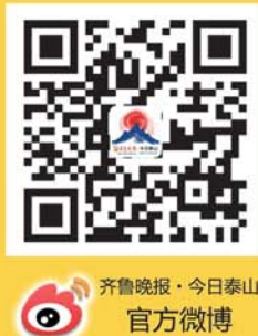
齐鲁晚报·今日泰山 官方微博