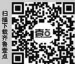
扫描下方二维码下载齐鲁壹点