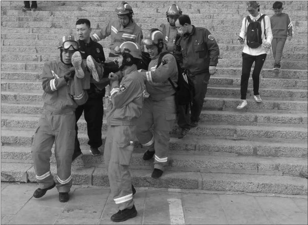
游客被众人抬出景区。