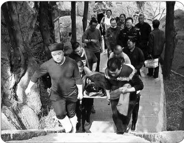
众人在山间小路上前行。

架上,然后往索道上站抬,和消防队员在道路途中回合,上演一幕生命救援接力赛。在元辰殿前,由消防队员接力,将游客运送至索道站,然后由索道运送下山,由在山下等候的急救车运送至医院。