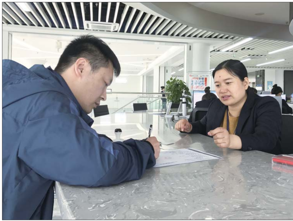
只要材料齐全,市民即可当场办结业务。