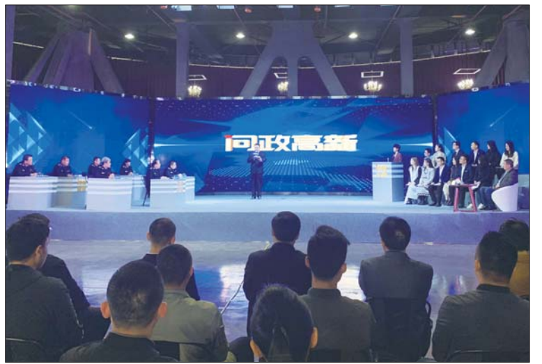
《问政高新》栏目录制现场。

场提出较为详实的整改意见和解决方法。而后,栏目记者还将持续进行跟踪报道,督促相关单位拿出解决问题的办法,凡是没有整改到位的,或者群众不满意、不认可的,将会严肃追责。 据了解,《问政高新》的推出,可有利于济宁高新区进一步促进作风转变和效能提升,使各级领导干部学会在监督下履职,把问政当做一面镜子、一个平台,通过接受问政提升领导能力和工作水平,推动责任落实和工作落实,助力高新区“三次创业”进程。