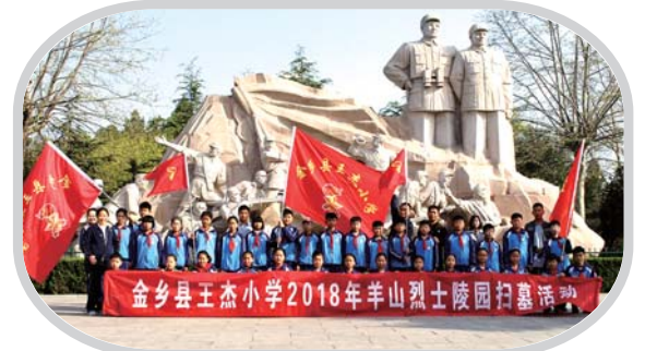
清明节，缅怀革命烈士，感悟人生价值。