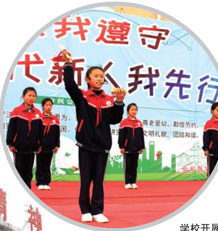
学校开展文明礼仪展演。