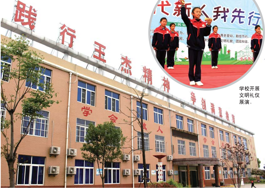
金乡县王杰小学校园。