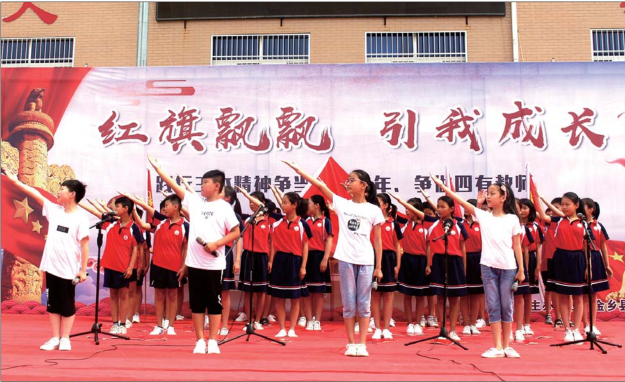
学校举行“红旗飘飘引我成长”活动。

每天上午的大课间时间，学校校歌——《王杰的歌我们唱》在校园内回响，学生们以班级为单位，在班主任老师的带领下共同唱响优美的旋律。“校歌是由我们学校原创的，歌词中不仅诠释了王杰精神的内涵，更告诉孩子们如何弘扬和传承英雄的精神，做新时代的合格接班人。”金乡县王杰小学党支部书记、校长李召军告诉记者，目前，学校共有26个教学班，学生1200余人，教职工76人。针对学校年轻教师多、学生年龄小的特点，学校开展了“我为学校添光彩”、“红旗飘飘引我成长”、“寻访英雄的足迹”、“读王杰日记”、“文明劝导”等形式多样的活动，进一步增强了全体师生的光荣感、使命感和责任感。