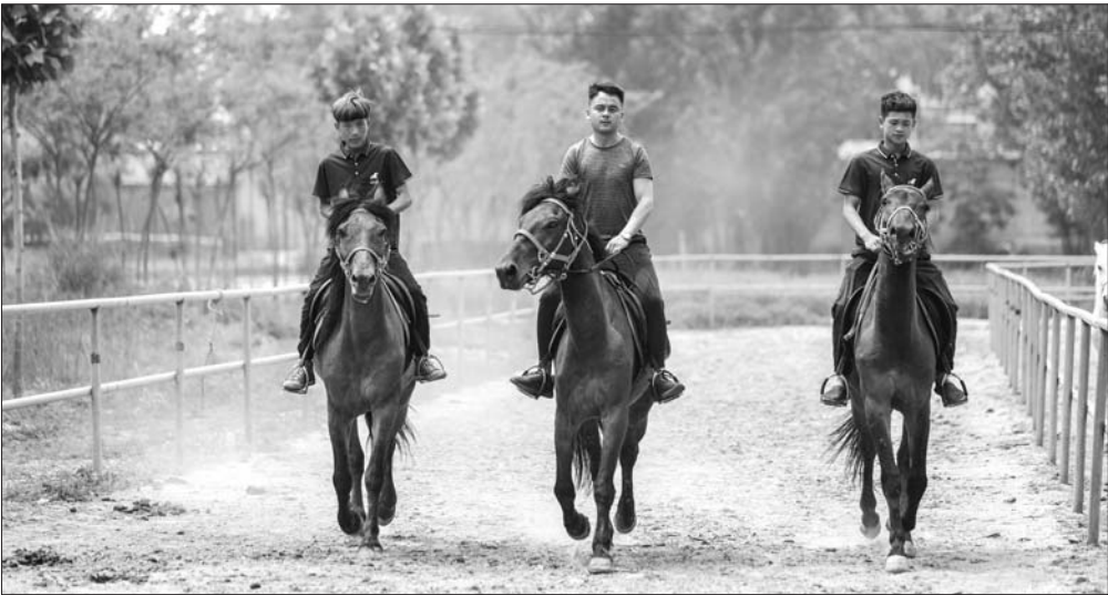
养马、驯马、售马，这群年轻人当起“马倌”。

“年轻人驯马有得天独厚的优势，他们身体素质好、胆子大，最重要的是喜欢骑马。”对这两位“00后”，王建和合伙人都很满意，老师傅们需要一两个月才能驯好的马儿，年轻小伙只需要不到半个月的时间。不仅如此，周末时还有更多的“00后”来到马场，学习骑马、遛马。