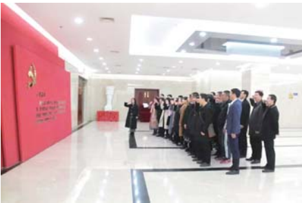
▲图为区实验中学党支部全体党员在“廉洁文登·昆崙清风”馆重温入党誓词。