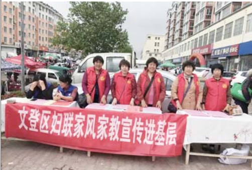
▲图为区妇联组织巾帼志愿者开展家风家教宣传进基层活动。