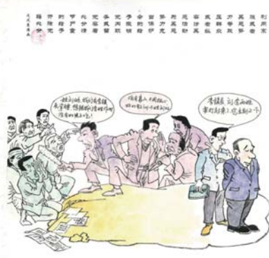
▲图为区纪委监委原创扫黑除恶专项斗争党纪漫画。

除恶务本,须拔其源。黑恶势力并不是一个孤立的存在,滋生黑恶势力需要一定的社会土壤。在一些地方出现黑恶势力,背后往往有贪腐的存在,一些掌握了一定权力的腐败分子为其充当“保护伞”。事实表明,凡是能够长期称霸一方、为非作恶的黑恶势力,无不背后有一项或多项“保护伞”,即使是一般的恶势力,后面也有人支持、纵容。而扫黑必须打掉“黑伞”,要铲除黑恶势力生存土壤。从扫黑除恶专项斗争开展以来各地区、各部门被拔掉的“保护伞”来看,可谓“扫”到了要害,“除”在了命门。实践证明,扫黑除恶,同步拔“保护伞”不仅事关能否“除恶务尽”,而且事关扫黑除恶专项斗争的成败。