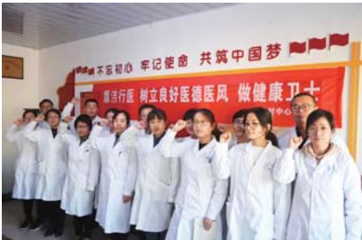
▲图为文登区宋村中心卫生院开展廉洁行医宣誓活动,建设廉洁医院走廊。