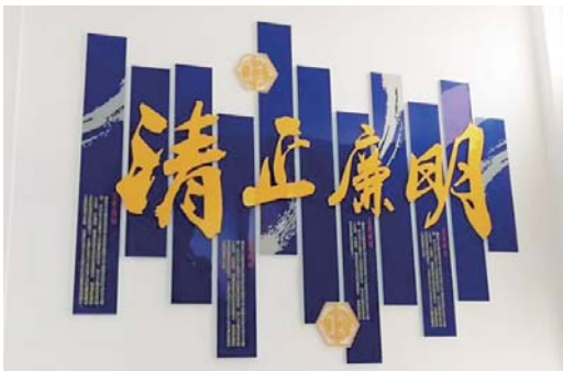
▲图为侯家镇采取农民画和展板形式在村居和机关中营造廉政文化氛围。