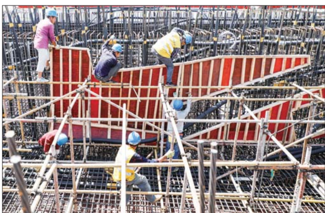
14号墩转体工程正在进行内模支设。

根据项目部发布的信息,此次封路自5月23日至6月15日,期间对太白楼路口4个交叉口进行全部封闭,路口仅对