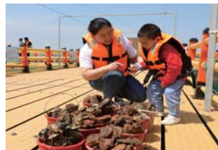
游客体验海洋采摘,收获颇丰。

在平台的带动下,汇悦旅游的名声打响了,越来越多的人慕名而来,看到如此情形,公司决定要加大投入力度,让阴山湾的优势得到更充分的利用,2017年,公司又在小平