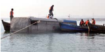
投放大型生态框架聚渔礁。

“我在网上看到网友说这里的海洋牧场不错,就想过来体验一下,在海参加工基地,我亲眼看到了海参的捕捞及加工过程,整个过程干净有序,我觉得挺不错的想买点回去尝尝。”一位来自淄博的游客说。汇悦海洋牧场地处渤海与黄海的交界处,四季分明,常年海水温度较低,藻类丰富,生长周期长,且伴随季节性洋流的循环回流,水质清纯无污染,所以在这一独特海域中生长的海产品,富含更多蛋白质,营养成分中氨基酸和微量元素的含量比较高,多糖类丰富,胆固醇低。