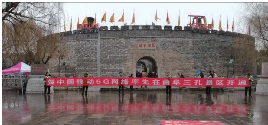
济宁移动率先在曲阜三孔景区开通5G网络助力智慧景区建设。

2019年1月29日，在曲阜三孔景区、高新区杨家河工业园、邹城荣信化工园区等区域陆续开通了济宁市首批5G实验基站，使济宁市成为继济南、青岛之后，省内第3个较早开展5G基站试点建设的城市。2019年2月14日，济宁移动举办了济宁市“5G+IPv6”首发仪式暨济宁移动“5G产业合作计划”启动大会，向全市人民展现5G对社会带来的深刻改变，并积极携手产业上下游合作伙伴，聚焦5G网络建设、应用创新和产业赋能，共同打造济宁移动5G生态圈，强化交流互鉴，深化合作促进，共同开启济宁5G发展美好未来。