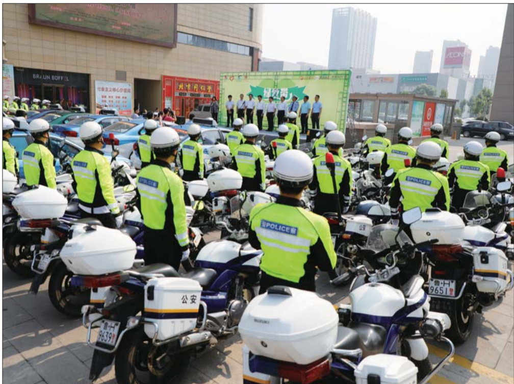
启动仪式上，出租车和警用摩托车系上绿丝带。

当前，济宁正共创文明城，主办方也发出倡议，高考期间，市民们共同为接送高考考生的车辆文明让行，提供便利，为高考学子们营造一个良好的考试环境。