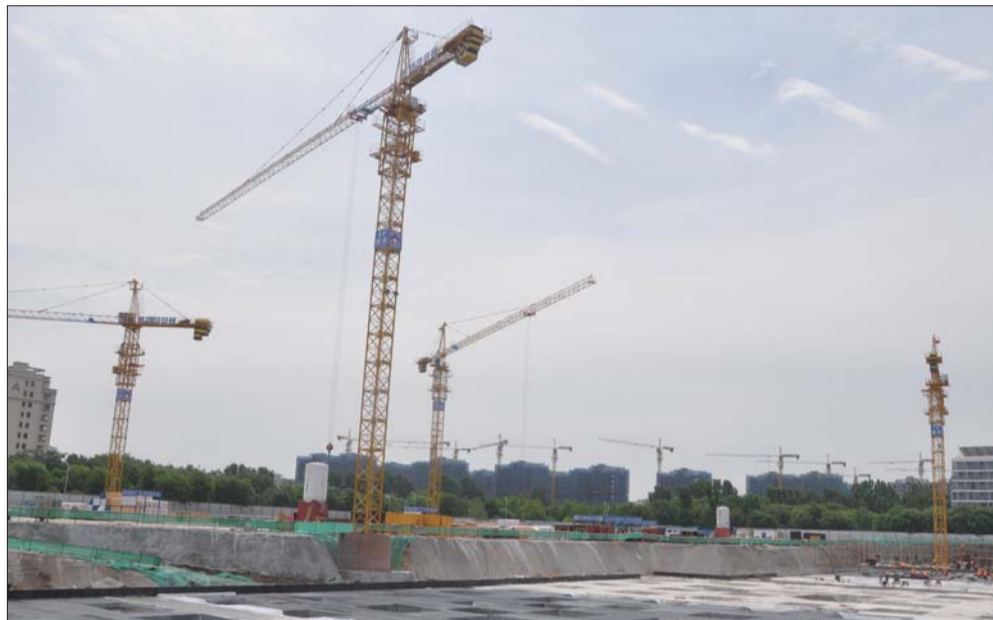
园区项目建设现场。

辰欣高端医药制剂、小松智能制造产业园、鑫六合智能安全产业园等项目纷纷落地杨家河科技产业园。项目不断落地，在进一步均衡杨家河科技产业园产业结构的同时，也成为了促进高新区新旧动能转换、助力“三次创业”的重要组成部分。为更好地服务园区企业，杨家河科技产业园牢牢把握高质量发展主题，牢固树立“人人都是项目建设服务员”的理念，提供优质“店小二”式服务，为企业发展营造良好营商环境。