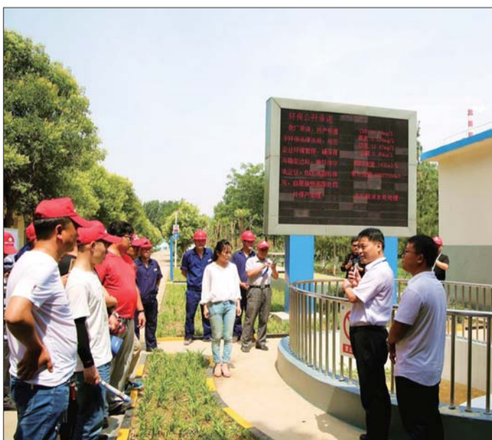
群众代表参观企业治污设施。

开放活动，主要向公众开放城市污水处理设施与危险废物处理设施。群众代表先后来到艾美科健医药有限公司、鲁抗中和环保科技有限公司、济宁银河水务有限公司实地参观三家企业的先进治污设施，认真聆听企业先进治污理念和先进治污技术。这三家企业分别是高浓污水产生、深度处理、终端处理的代表性企业，让参观群众直观了解了高浓度污水从产生到最终处理排放的全过程。在参观过程中，企业相关负责人耐心讲解每一处环保设施的技术原理。参观群众代表边走边看，边听边议，并虚心向企业负责人讨教治污先进理念和治污设施技术原理。