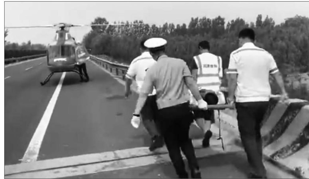
伤者被抬上救援直升机。

本报济宁6月5日讯(记者 褚思雨 通讯员 胡安国) 5日,壹粉“完美视界”向齐鲁晚报官方客户端齐鲁壹点情报站发来爆料,日兰高速曲阜段发生一起车祸,有人腿部受伤。因事故地点堵车,救护车无法到达现场。济宁市高速交警支队与济宁市第一人民医院“空中120”联动,30分钟