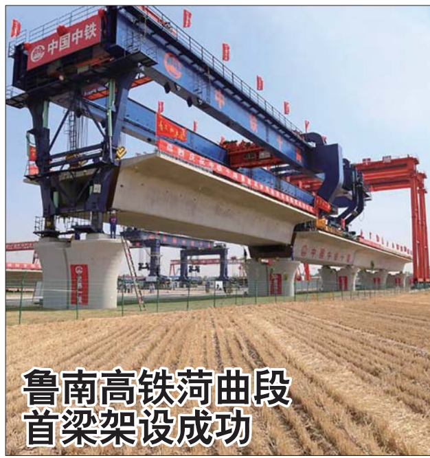
鲁南高铁菏曲段首梁架设成功

按照《办法》规定,市城市管理委员会每月10日前通报上月考核情况,在新闻媒体公布考核结果,对每月排名前3位的县区和排名全市前5位的街道、前10位的乡镇通报表扬;对每月排名后2位的县区和排名全市后3位的街道、后5位的乡镇通报批评。并按照季度考核得分排名,分别对季度排名前3位的县区和排名全市前5位的街道、前10位的乡镇进行奖励(含并列),县区依次奖励50万元、30万元、20万元,街道、乡镇各奖励10万元。