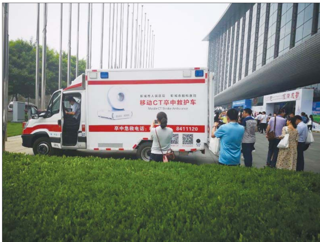
聊城市人民医院脑科医院移动CT卒中救护车。

生委“国家脑卒中筛查与防治基地”、“国家高级卒中中心”、“国家高级卒中中心先进单位”,推进脑卒中预防、健康教育、急性期规范救治的全流程全生命周期管理机制,目前已初步建成“冀鲁豫边区脑卒中预防与救治服务体系”,全市及周边近30家医院加入“脑卒中急救服务圈”,服务范围辐射冀鲁豫边区,形成冀鲁豫边区完善的急性脑卒中救治网。