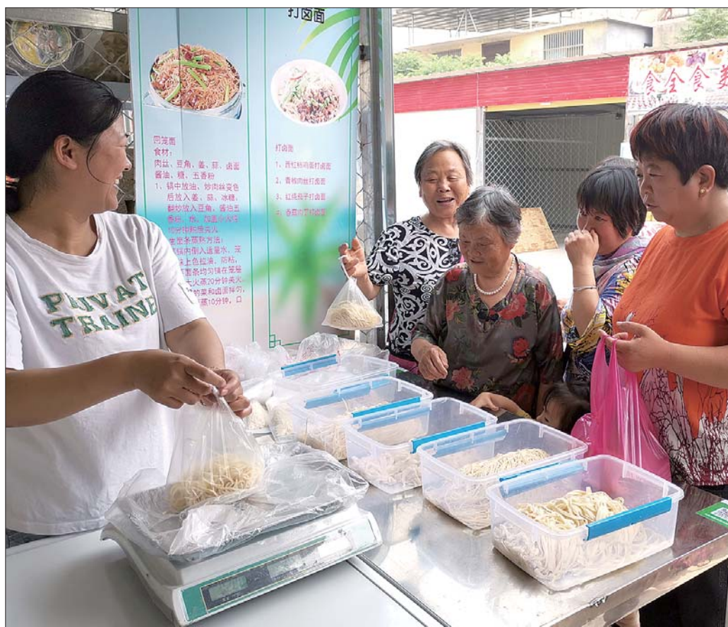
市民正在百花便民市场购物。

本报菏泽6月17日讯(记者潘涛) 17日上午,在菏泽市牡丹区牡丹街道办事处百花园北邻的百花便民市场内,60余家商铺整齐有序地经营,居民游逛其中,时而品尝,时而砍价购买……一派繁盛、有序的景象,怎么也不会让人想起,几个月前,此处还是一个垃圾遍地的旧坑塘,而今摇身一变成了周边8个居民区的“菜篮子”。