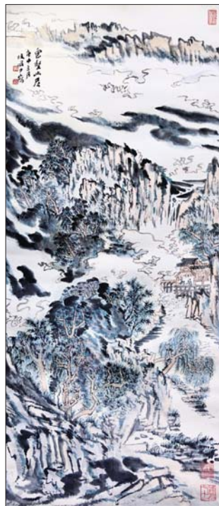
▲云壑幽居图 陆俨少