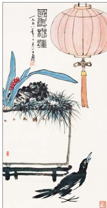
▲国寿无疆图 潘天寿