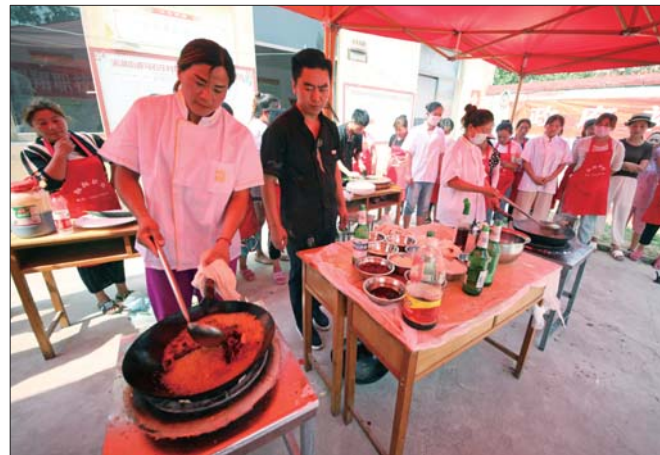
免费职业技能培训送到村里头。