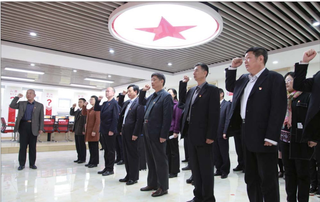
济宁市人社局机关党委开展“人社新时代·党员在行动”主题党日活动。

一直以来,济宁市人社局把党建工作纳入全局总体工作盘子,以“民生为本、人才优先”为主线,不断促进党务与业务相融合,发挥党员模范带头作用,牢牢守住就业基本盘、促进社会保障公平可持续、不断厚植人才新优势、切实维护劳动者权益。