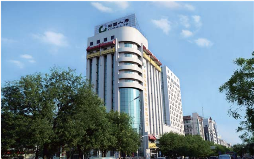
中国人寿济宁分公司大楼。

作,牢固树立“融入中心抓党建,抓好党建促发展”工作思路,抓好、抓牢、抓实基层党建工作,以党的坚强领导汇聚公司转型高质量发展强大动能,在加快自身发展同时,勇于担当国有企业社会责任,为助力济宁经济社会发展和民生保障建设做出积极贡献。公司先后被授予“中国人寿系统先进基层党组织”、“保险业先进单位”、“重点服务企业”、“省三八红旗集体”、“省级文明单位”、“省级守合同重信用企业”、“济宁市五一劳动奖状”等多项荣誉称号,市公司客服柜面被评为“全国巾帼文明岗”称号。