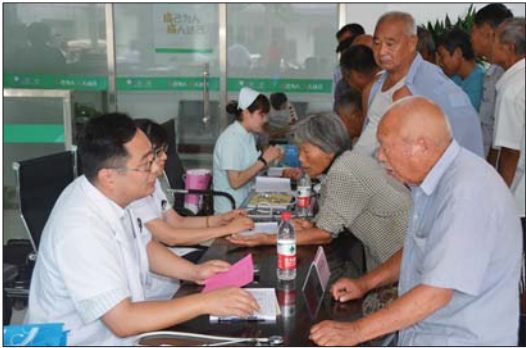
中国人寿济宁分公司联合济医附院开展下乡爱心义诊。

年,站在历史新的起点展望未来,面对新形势、新任务,中国人寿济宁分公司将坚持以习近平新时代中国特色社会主义思想为指导,全面贯彻党的十九大、十九届二中、三中全会精神,持之以恒抓牢抓实基层党建,以党的坚强科学领导助力公司向高质量发展目标加速迈进,以优异成绩庆祝新中国成立70周年。