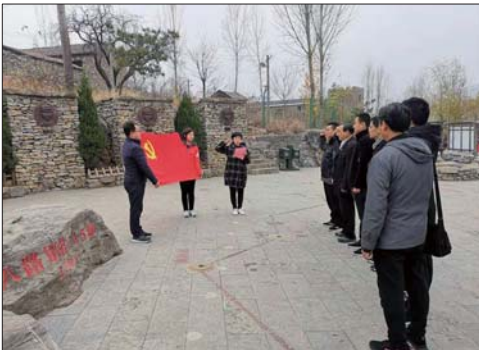
中国人寿济宁分公司开展红色教育活动。

筑牢党组织根基,凝聚全员战斗力、向心力,推动公司加快实现转型升级、高质量发展目标。 建实党员队伍。 目前,公司全辖共有党支部35个,其中营