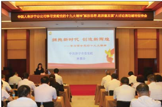
邀请市委党校教授讲授党的十九大精神。

公司始终坚持以“抓党建促发展”为统领,持续深化强化全员思想、政治、组织、作风、能力建设,统筹基层党建与日常经营,不断创新工作思路,夯实