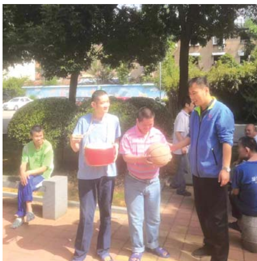
让智障人员的生活多姿多彩