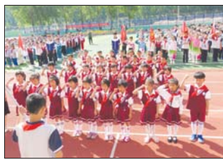
沂源县三岔中心学校举行了一年级学生加入少先队入队仪式。(元和田)