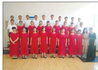
沂源县三岔中心学校成立教职工合唱团并定期开展活动。(元和田)