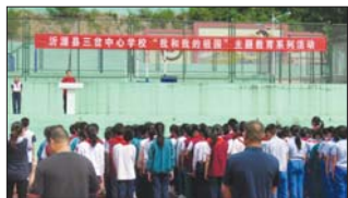
沂源县三岔中心学校举行主题教育活动。(元和田)