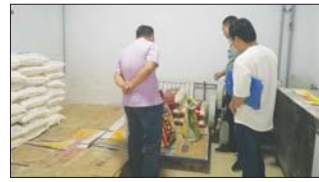
沂源县三岔中心学校加强餐厅检查力度。(元和田)