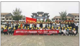
沂源县三岔中心学校学生开展研学活动。(元和田)