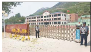
沂源县三岔中心学校进一步加强安保工作。(元和田)