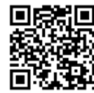
学院官方网站QQ二维码