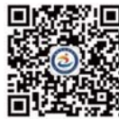
学院微信公众号二维码