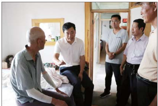
▲图为7月16日,姜全文来到老党员家中看望慰问。

近日,区委常委、区纪委书记、区监委主任姜全文先后来到界石镇、文登抽水蓄能有限公司和金山管委,围绕落实全区巡察工作座谈会精神、服务重大项目保民生、国企纪委履职及基层廉政文化建设等工作进行督导调研,推进勤廉广场建设,同镇街、企业主要负责同志开展廉政座谈,促进党风廉政建设主体责任和监督责任落实落地。