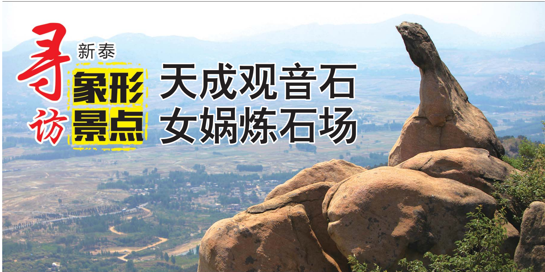
莲花山天成观音