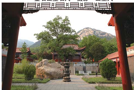
莲花山观音院