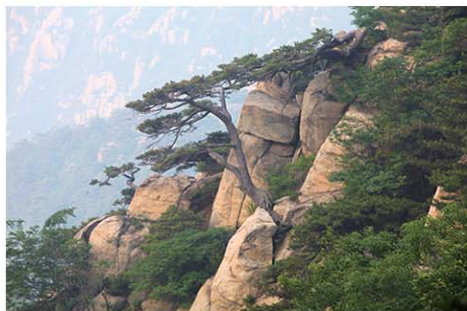
莲花山望人松 摄影 山里人