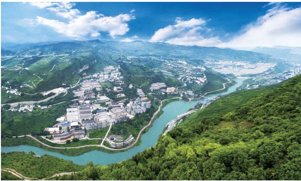
习酒公司十里酒城

据了解，全国质量奖于2001年设立，目的在于“激励和引导我国企业追求卓越的质量经营，增强组织综合竞争能力，更好地适应经济全球化发展趋势，使组织更好地服务用户、服务社会”。评审标准以卓越绩效模式标准为主，是我国在质量方面的最高奖项之一。