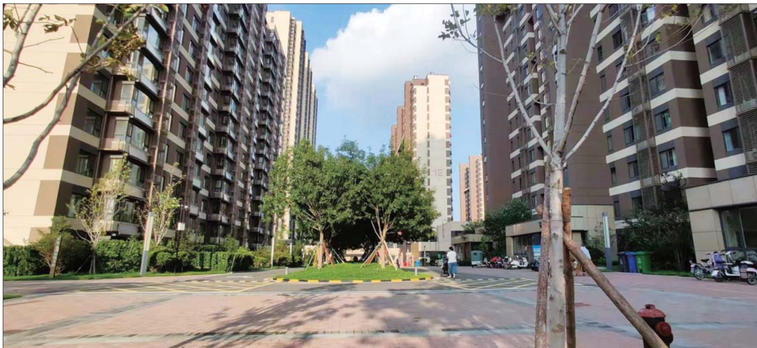
现在精装修整体的品质更完善,品质更高,相对成本更节省。