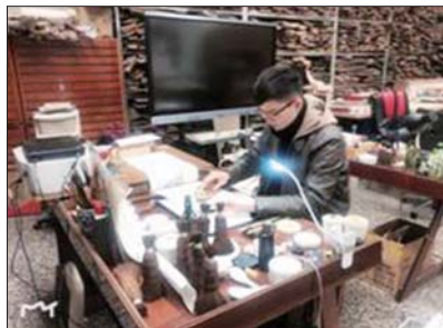
《芥子园画传》翻刻实践