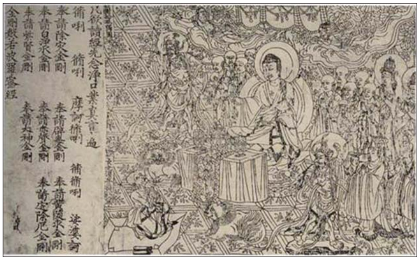
▲唐868年咸通本《金刚般若罗密经》扉画