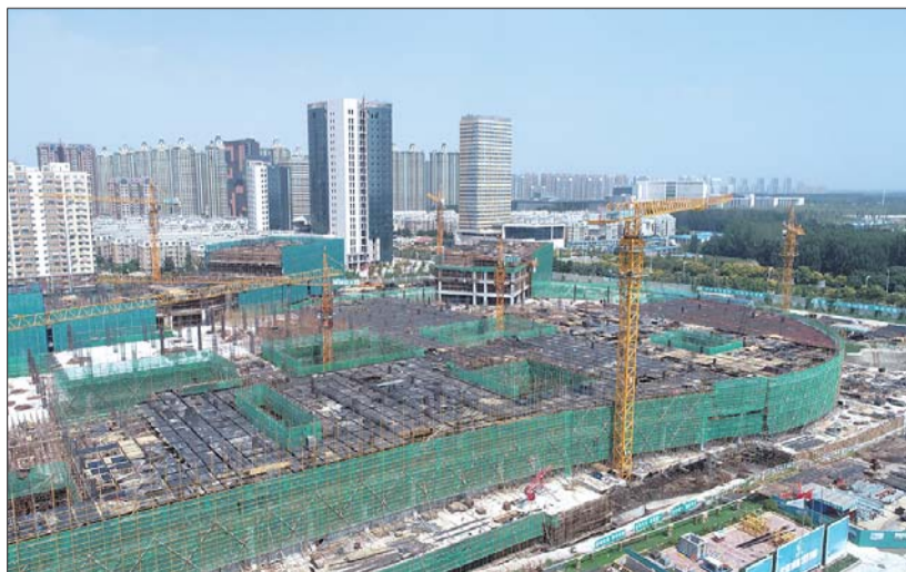
济宁市立医院(附院分院)项目现雏形。