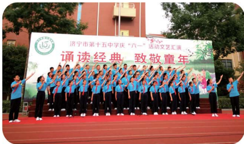
朗诵经典,致敬童年。

询师对学生进行心理健康教育,进行好心理咨询,解决学生的心理负担和心理疾病。搞好家校共育,稳步推进家长进校园“十个一”活动:一次课堂观察;一次晨读帮扶;一次监考体验;一次家长授课;一次阳光跑操;一次主题班会;一次亲子活动;一次校外实践;一次分层助教;一次家长培训。让家长根据自身资源和需要,自主选择参与家校活动,从而加强家校沟通,形成教育合力。