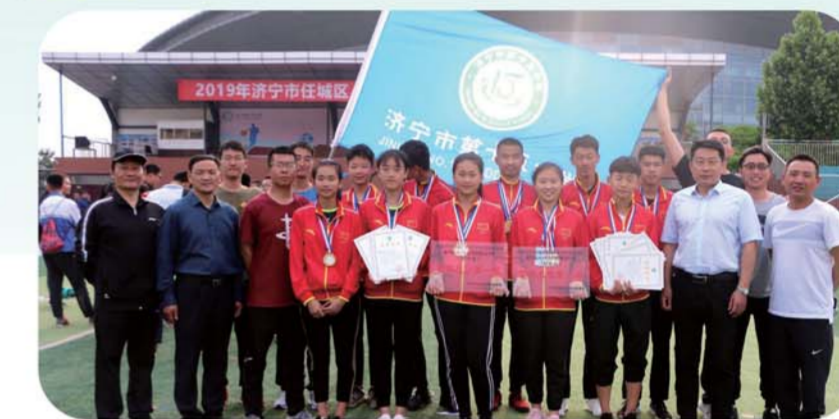
2019年任城区中小学田径运动会,十五中获“双第一”。

固化传统活动,打造活力校园,周周有活动,月月有赛事。定期召开合唱节、美术展览、艺术节等活动,培养学生健康的审美情趣和高尚的审美情操,提高学生的艺术欣赏能力和人文素养。在全省艺术展演活动中,学校的器乐表演《渔舟唱晚》、课本剧表演《邹忌讽齐王纳谏》荣获二等奖。