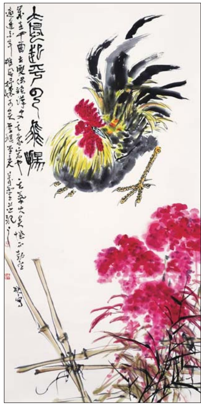
▲大风起兮云飞扬 86x136cm 孙万灵