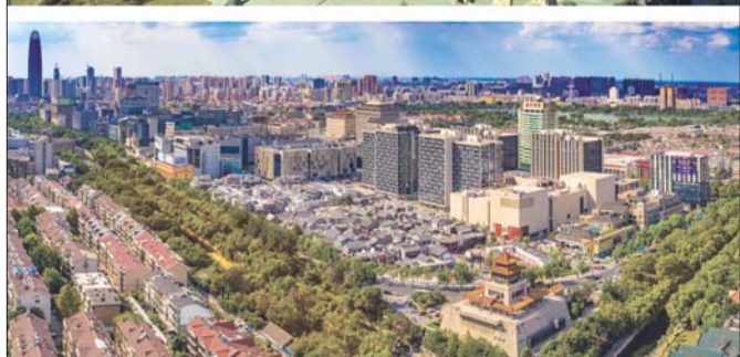
济南老城变迁。