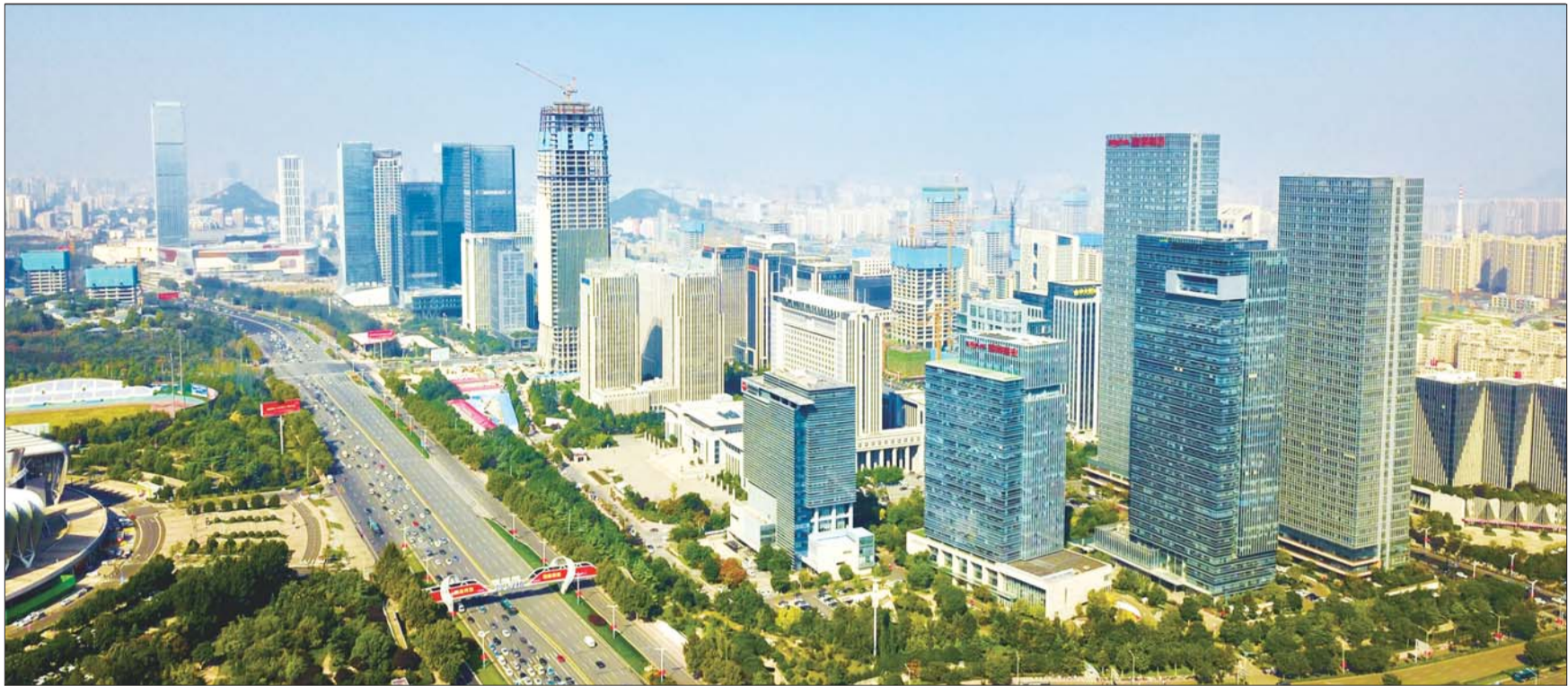
济南经十路沿线林立的高楼,见证着济南飞速的发展。