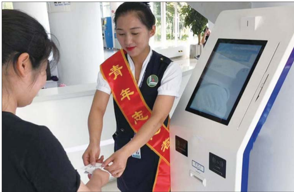
为民服务中心志愿者主动引导群众办理相关业务。

自行政执法“三项制度”推行以来,济宁高新区严格按照省、市相关要求,规范公正文明执法,将行政执法公示制度的落实情况体现在执法活动的方方面面,切实保证群众知情权、参与权,为高新区营造亲民便民氛围,打造一流营商环境提供坚强保障。