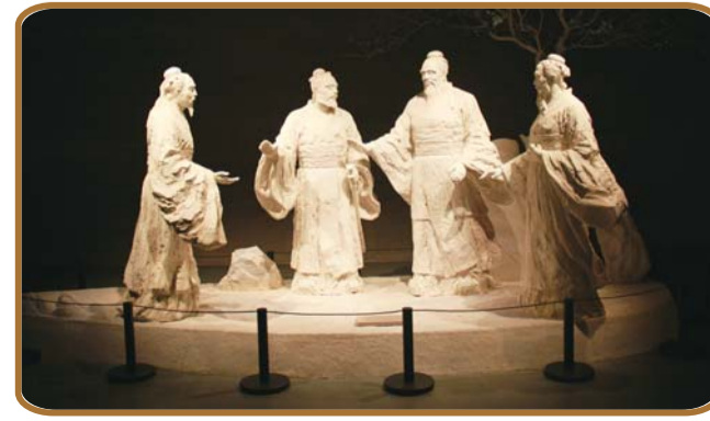
馆内的雕像十分精致。