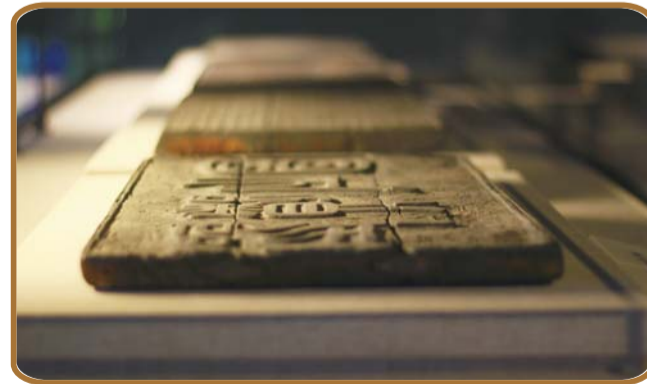
不少馆藏文物首次亮相。